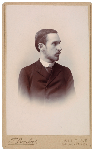
1. В. В. Бартольд [СПбФ АРАН, ф. 68, оп. 1, д. 509, л. 1] V. V. Barthold [SPbF АРАН, f. 68, op. 1, d. 509, n. 1]